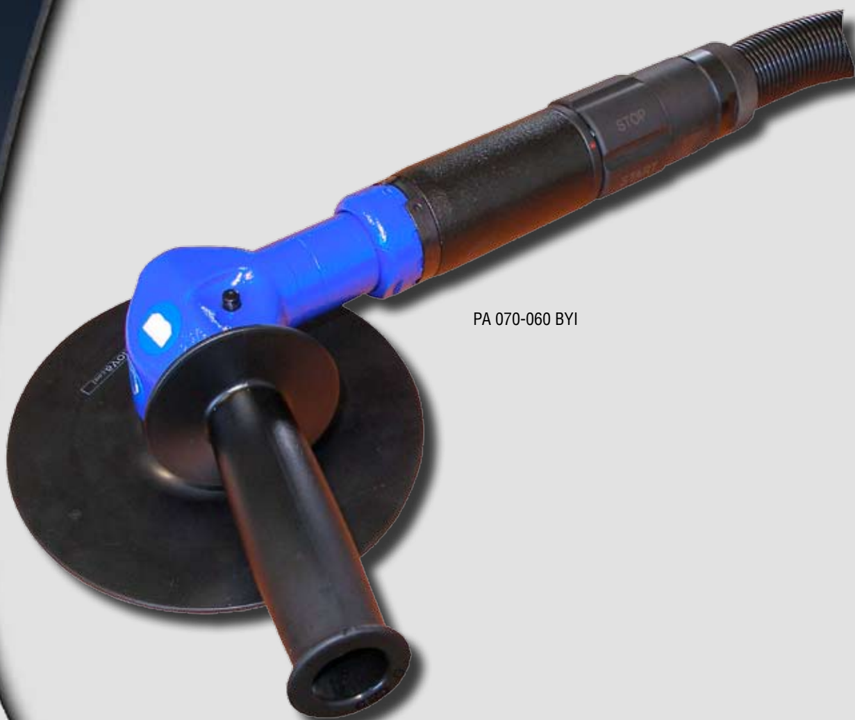
PA 070-060 BY1

Пневматическая угловая полировальная машинка Тип PA 070-060 BY1