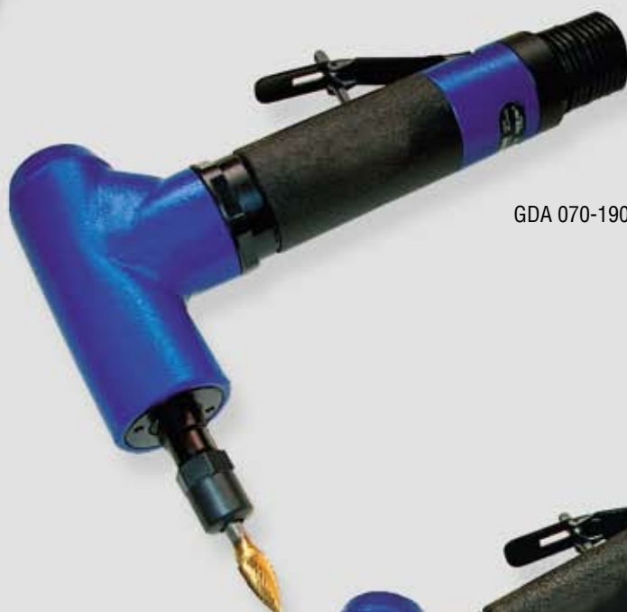
GDA 070-190 BX