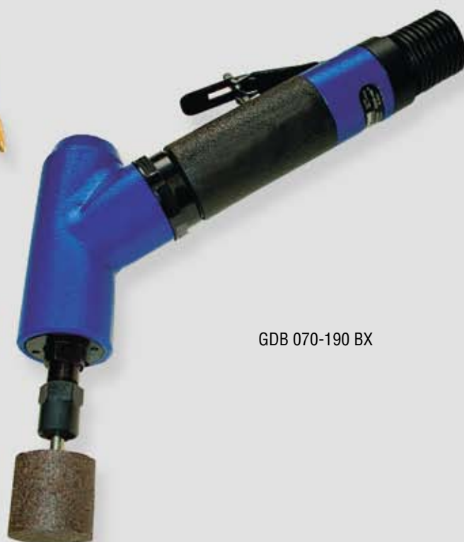
GDB 070-190 BX