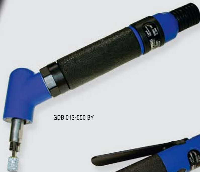
GDB 013-550 BY

Пневматические шлифовальные машинки с цанговым зажимом Тип GDA, GDB 013-550 BX, BY, SX, SY мощность: 0,13 kW