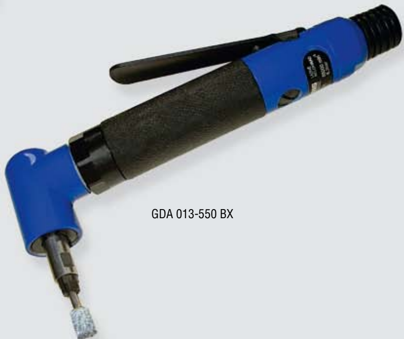
GDA 013-550 BX