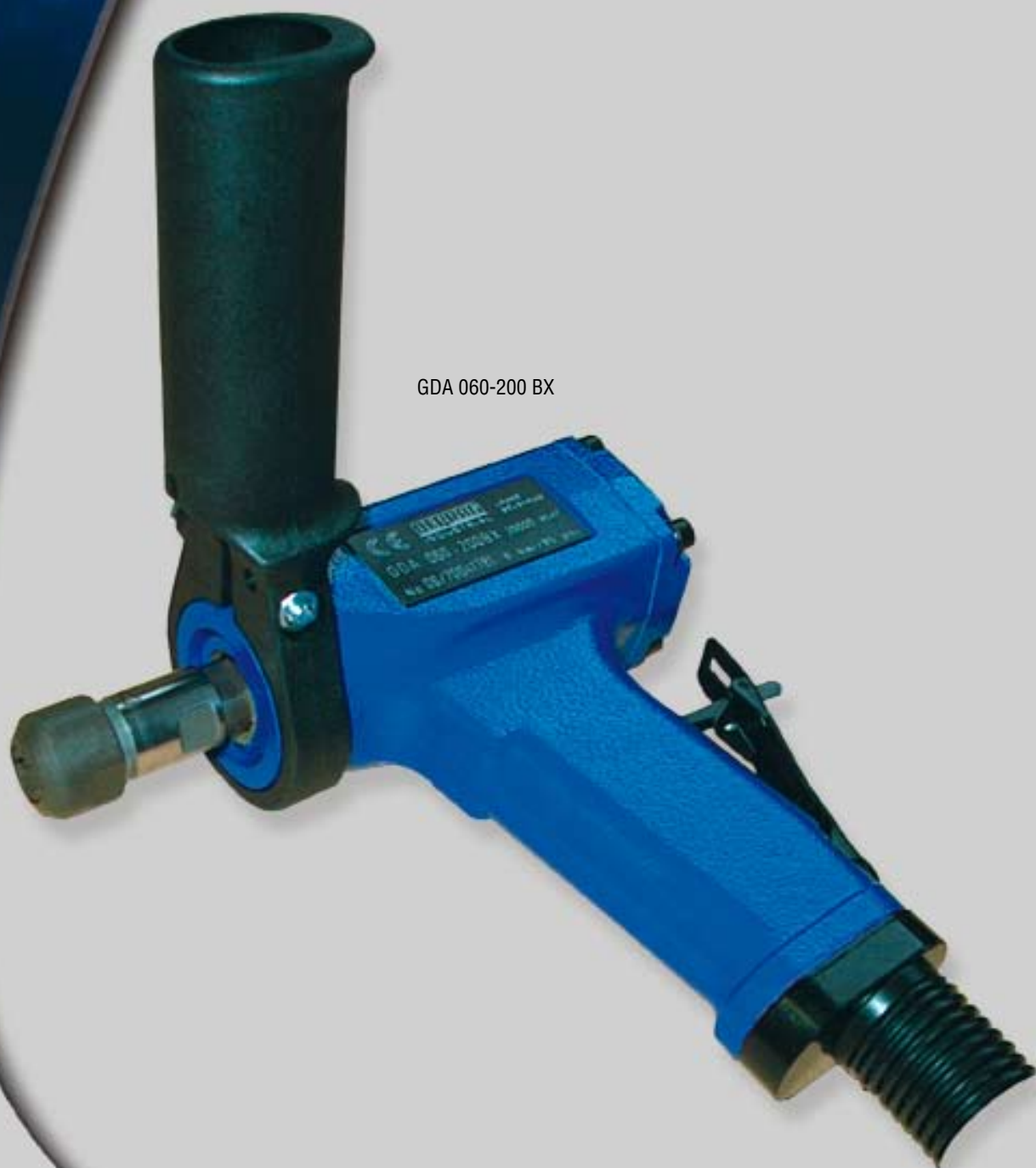
GDA 060-200 BX